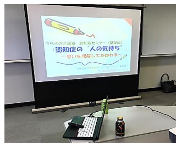
ステップアップ研修・認定トレーナー

認知症トレーナー養成講座で使用した基本スライドとは別に、様々な介護場面に対応できるようバージョンアップしたNEWコンテンツを習得できます。研修では、各コンテンツの意図、効果的な講義方法など、追加コンテンツの活かし方を、3人の認定トレーナーから、しっかり学ぶことができます。もちろん、スライドデータ(パワーポイント)・台本を持ち帰ってもらえますので、受講したその日から、あなたの講義の幅が最大限に広がります！！