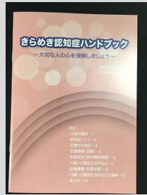
認知症ハンドブック