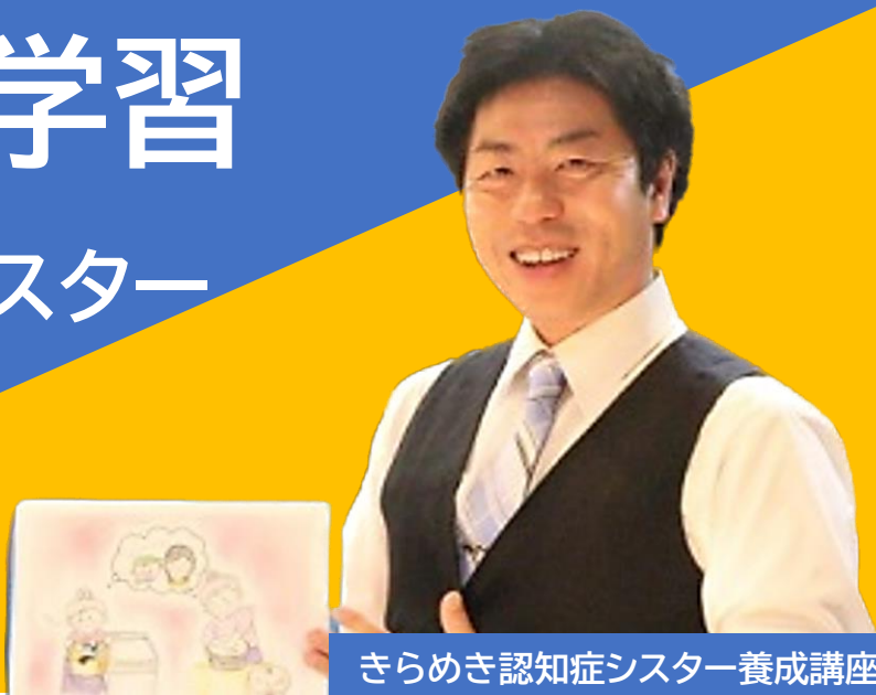
きらめき認知症シスター養成講座